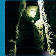
被苔蘚覆蓋的綠色溪谷 「苔之洞門」

能夠在此觀賞到小型水鳥「鷺鷥」自由在地游動、潛水。如果運氣好的話，還可能觀賞到其捕魚進食的瞬間。