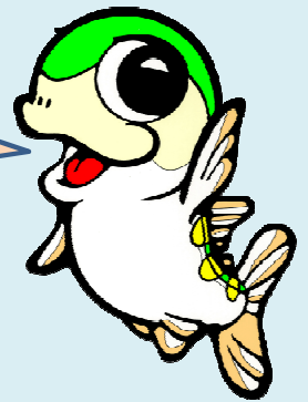
サケのふるさと千歳水族館 マスコットキャラクター 「サモン君」

千歳水族館から → 北々亭千歳店 ご利用の場合 千歳水族館の入館半券を北々亭千歳店お会計時にスタッフまで ご提示ください。